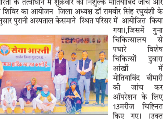
हरिभूमि न्यूज़ ►► आरोग